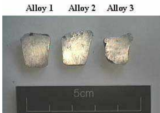
Figura 3: Las muestras después de la aplicación de la amalgama.

Teniendo en cuenta lo expuesto en este último punto, se llevó a cabo una nueva serie de experimentos (Serie C). La amalgama se logró, como se indica por Teófilo, con cinco partes de mercurio de una plata mezcladas juntas y se calentó a 100 °C durante cinco días. A continuación, la mezcla se prensó en una tela y otra vez se trituroó en un mortero para obtener una pasta consistente. Tres aleaciones diferentes se utilizaron como sustratos de metal para verificar su posible influencia en el resultado del plateado. La aleación 1 imitaba la composición de la aleación de las monedas romanas del Bajo Imperio (Cu 88%, Ag 2%, Sn 5%, Pb 5%); la aleación 2 era binaria, de cobre y estaño (Cu 95 %, Sn 5%); lo mismo que la Aleación 3 a la que se añadió plomo (Cu 90 %, Sn 5%, Pb 5%). La amalgama se extendió sobre ambas superficies de las muestras con una espátula de acero inoxidable y el agente humectante consistió en ácido nítrico diluido al 5% (Figura 3).