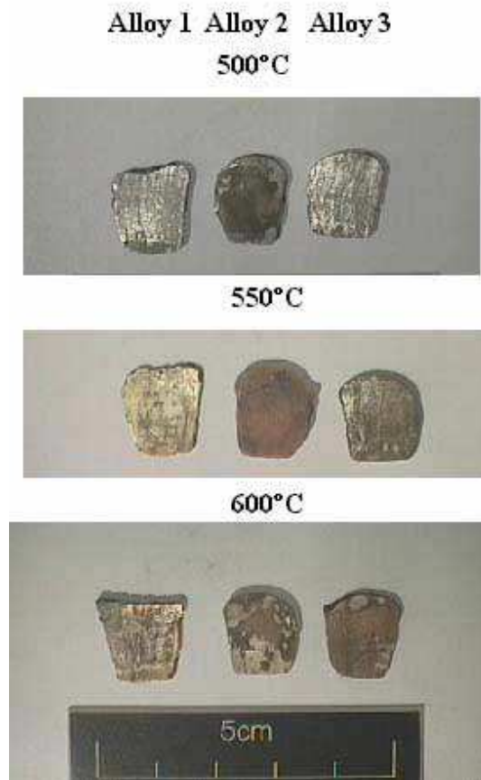
Figura 4: Las muestras después del calentamiento durante 20 minutos a 500°C, 550°C y 600°C.

La aleación 2 fue menos eficiente que las otras en el curso de este experimento. Su plateado no sobrevivió a la cocción a 500 °C (Figura 4). A temperaturas más altas, las diferencias entre las dos aleaciones han surgido. El plateado de la aleación 3 aguantó la cocción a 500 °C pero no a 550 °C. Sólo el plateado de la aleación 1 pudo resistir después de cocción a 600 °C. En general, la aleación 1 mostró la mejor resistencia a las altas temperaturas. Además, la concentración de mercurio en la superficie de las muestras varía considerablemente. A 360 °C, justo por encima del punto de ebullición del mercurio, el plateado de la aleación 2 contenía sólo el 45 % de mercurio, mientras la aleación 1 contenía el 62% y el 69% la aleación 3. La superficie de la aleación 1 contenía, después de la cocción a 600 °C durante 20 minutos, el 12-13% de mercurio.